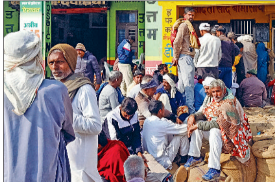
भिवानी। अनाजमंडी में दी बवानीखेड़ा कॉर्पोरेटिव मार्केटिंग कम प्रोसेसिंग सोसाइटी में खाद लेने के लिए लगी किसानों की लंबी लाइन।