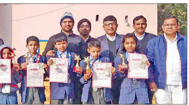
महेंद्रगढ़। बच्चों को सम्मानित करते हुए।