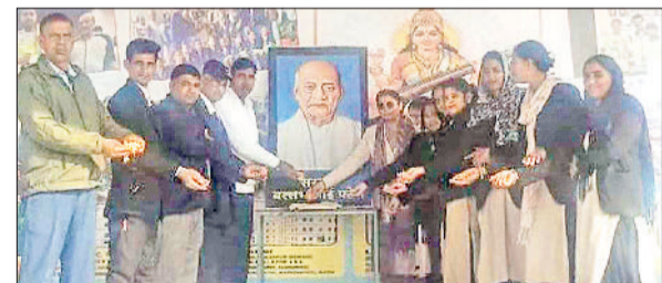
महेंद्रगढ़। सरकार पटेल के चित्र पर पुष्पापित करते हुए।