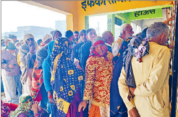
भिवानी। अनाजमंडी में दी बवानीखेड़ा कॉर्पोरेटिव मार्केटिंग कम प्रोसेसिंग सोसाइटी में खाद लेने के लिए लगी किसानों की लंबी लाइन।

कभी मौसम तो कभी पानी की मार से परेशान अन्नदाता अब यूरिया खाद लेने के लिए संघर्ष करने को मजबूर हैं। किसान यूरिया के लिए बवानीखेड़ा की अनाजमंडी स्थित दी बवानीखेड़ा कॉर्पोरेटिव मार्केटिंग कम प्रोसेसिंग सोसाइटी के बाहर काफी परेशानी झेलते दिखे। अब खेती करना काफी मुश्किल होता जा रहा है। कभी किसान पर मौसम की मार तो कभी पानी की मार पड़ जाती है और आर्थिक रूप से टूट जाता है, अब किसान को खेती एवं अपनी फसल के लिए यूरिया खाद की आवश्यकता है तो वह भी उसे आसानी से उपलब्ध नहीं हो पा रही। किसान को धुंध के मौसम में भी अलसुबह उठकर सोसाइटी के बाहर लंबी लांबी लाइनों में लगना पड़ रहा है। धुंध में किसानों को लाइनों में लगा हुआ देखा जा सकता है। नागरिक अस्पताल के पास स्थित सोसाइटी व अनाजमंडी